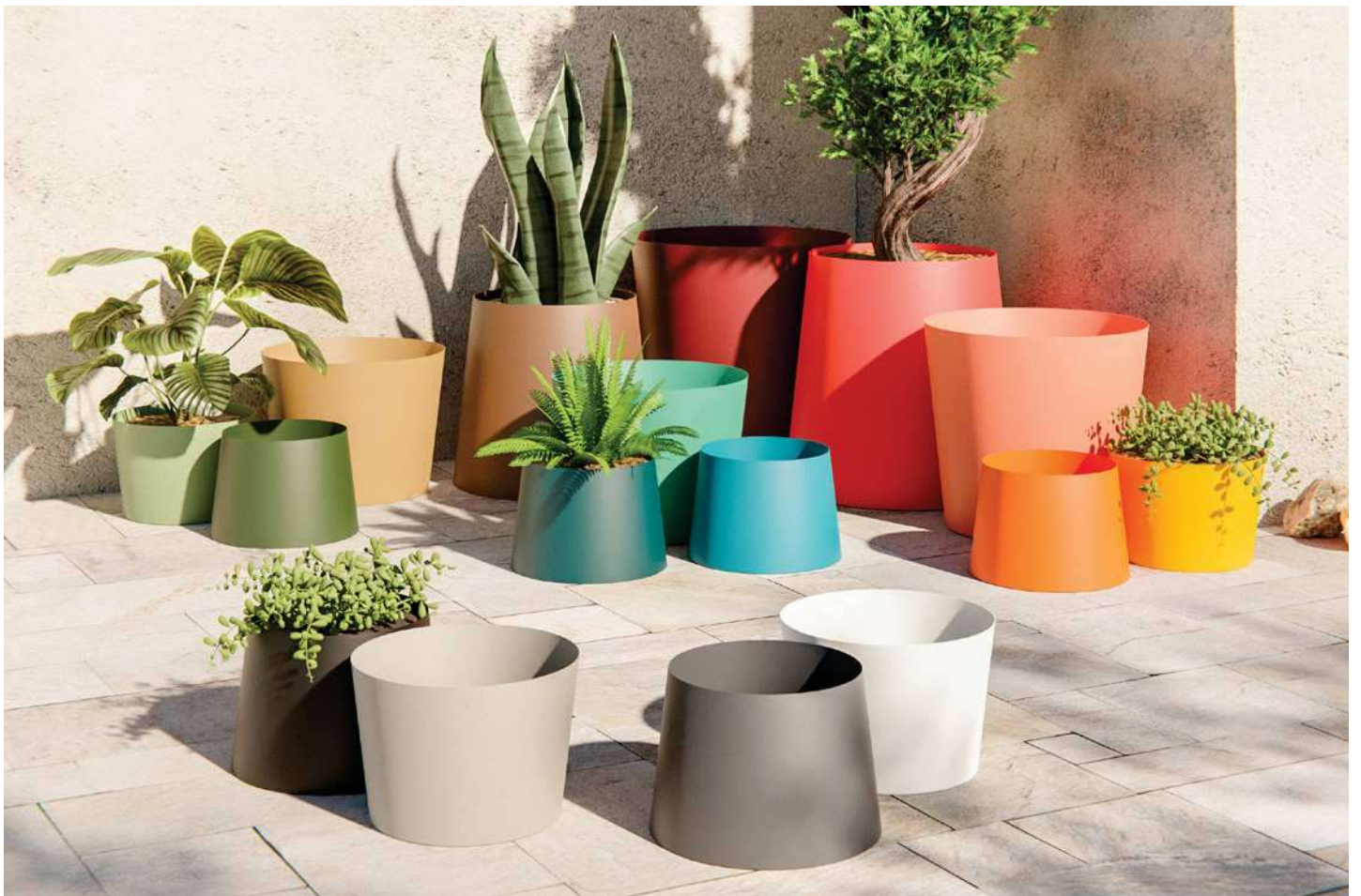
RANGE 16 COLORS