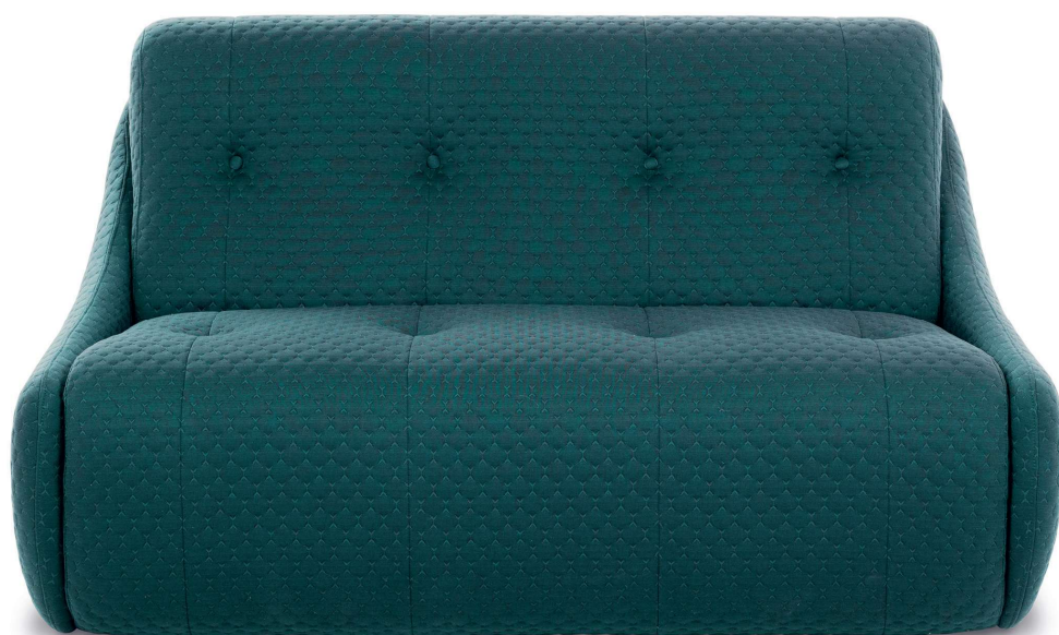
Canapé 2 places tissu Cloud 35