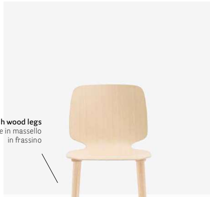
Solid ash wood legs Gambe in massello in frassino