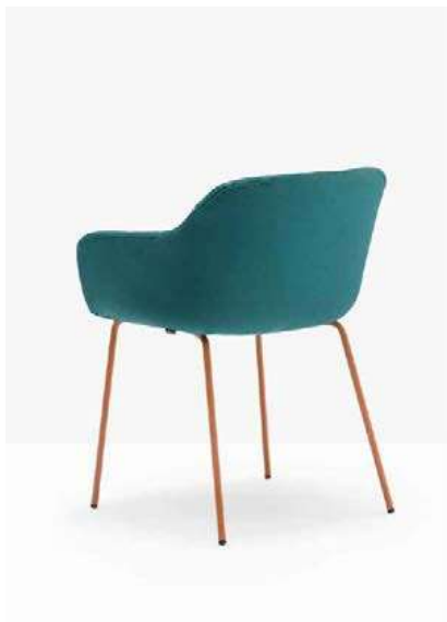
ARMCHAIR / POLTRONA