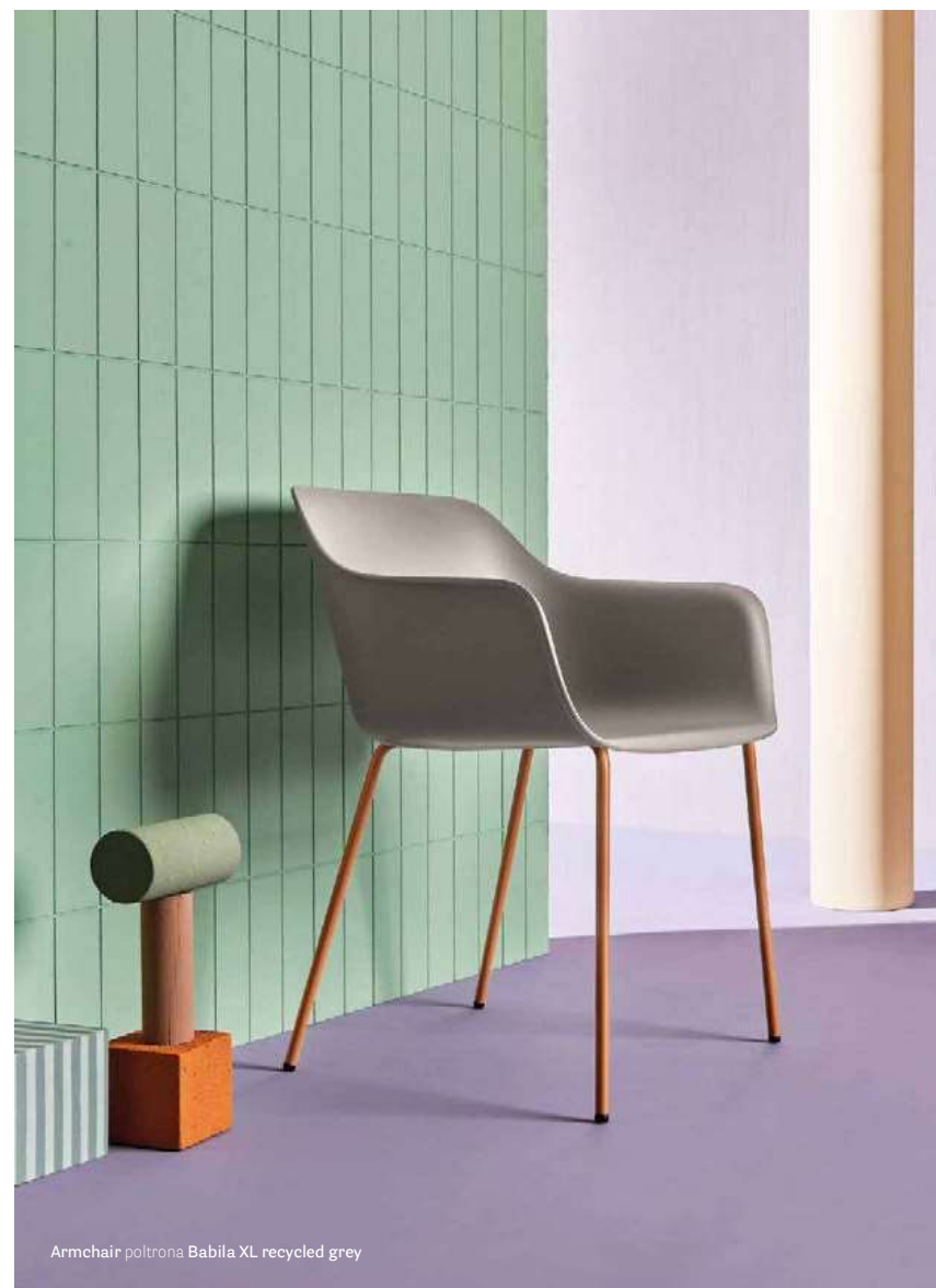
Armchair poltrona Babila XL recycled grey