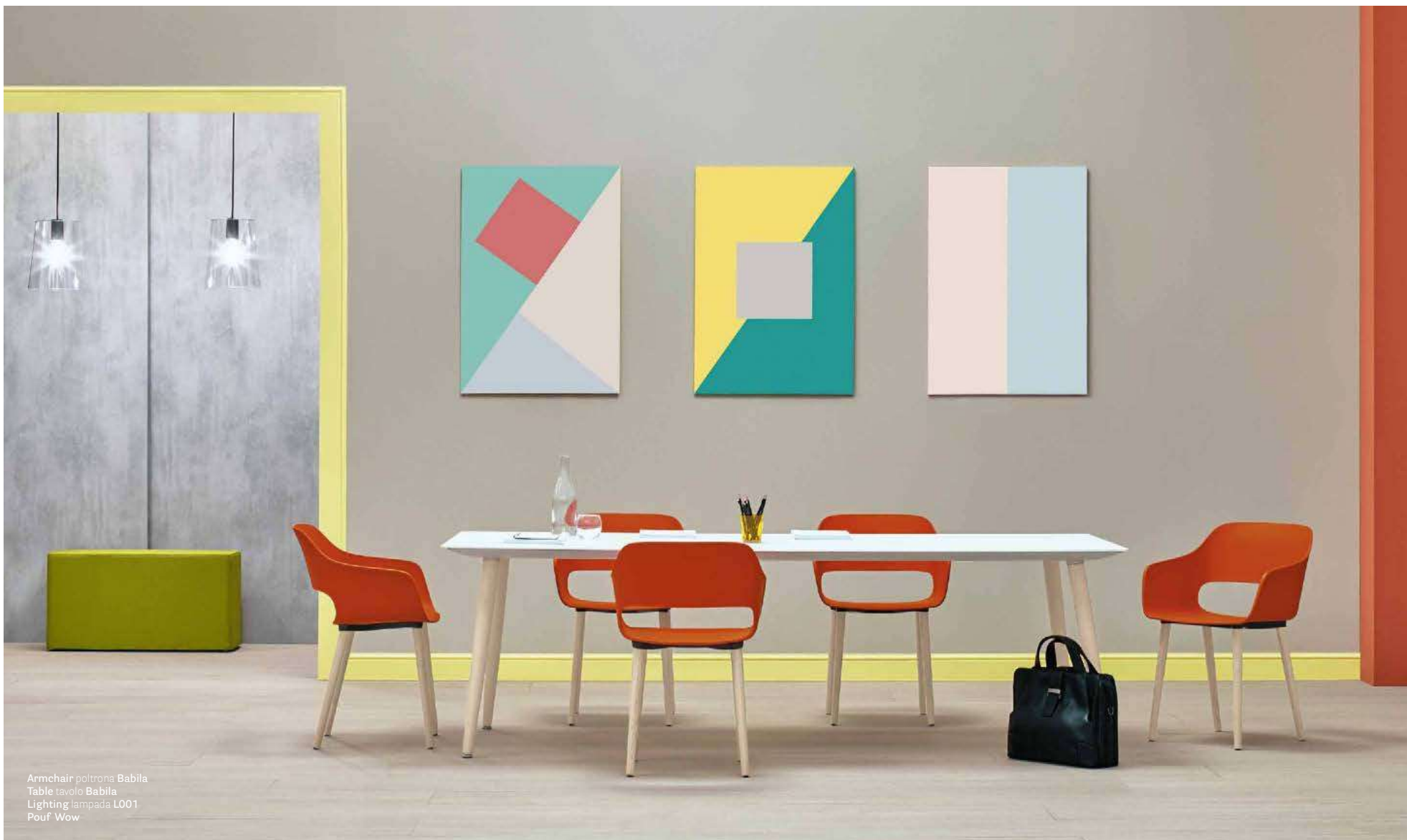
Armchair poltrona Babila Table tavolo Babila Lighting lampada L001 Pouf Wow