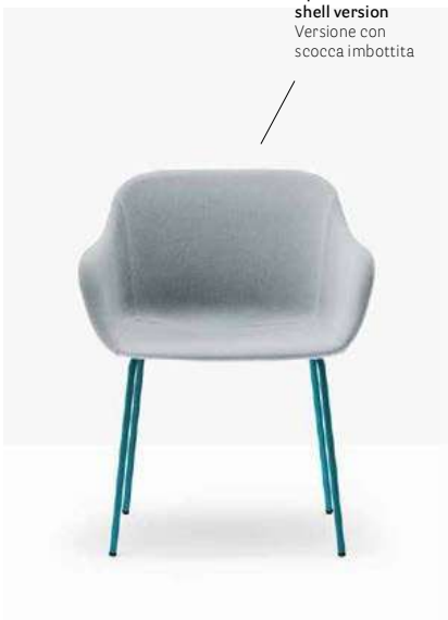
Upholstered shell version Versione con scocca imbottita