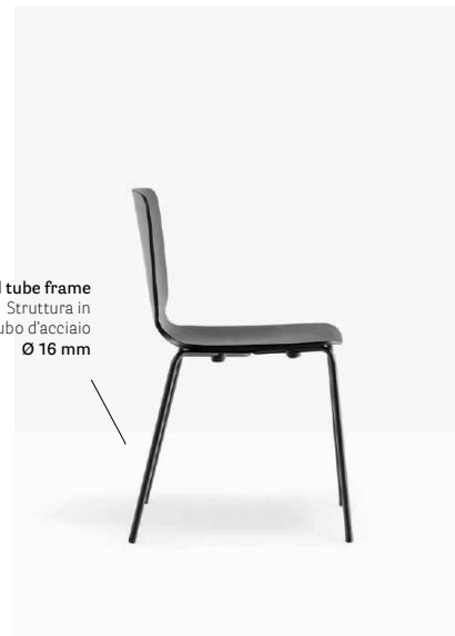
Steel tube frame Struttura in tubo d'acciaio Ø 16 mm