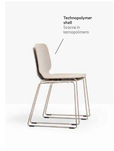
Technopolymer shell Scocca in tecnopolimero