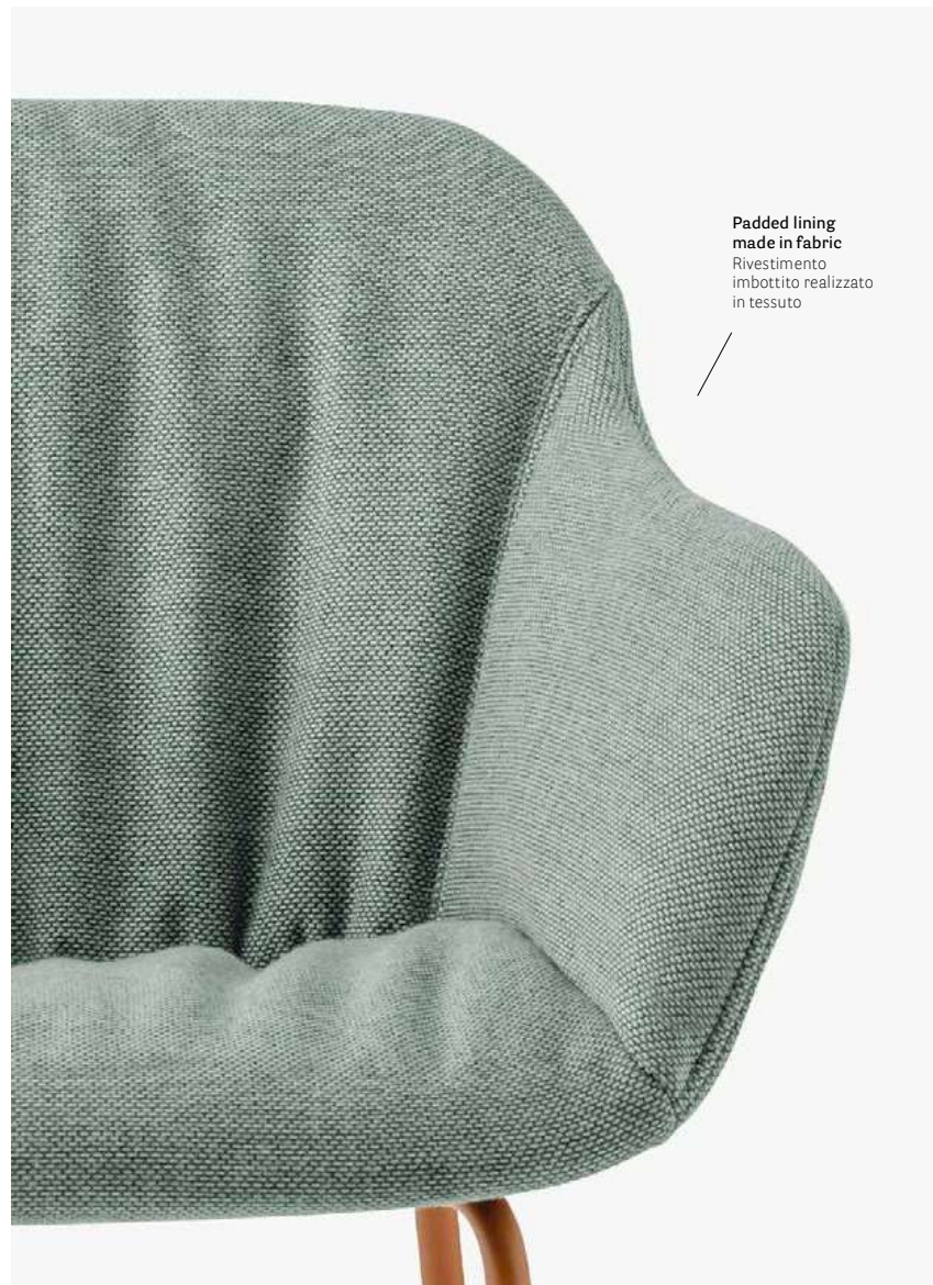
Padded lining made in fabric Rivestimento imbottito realizzato in tessuto