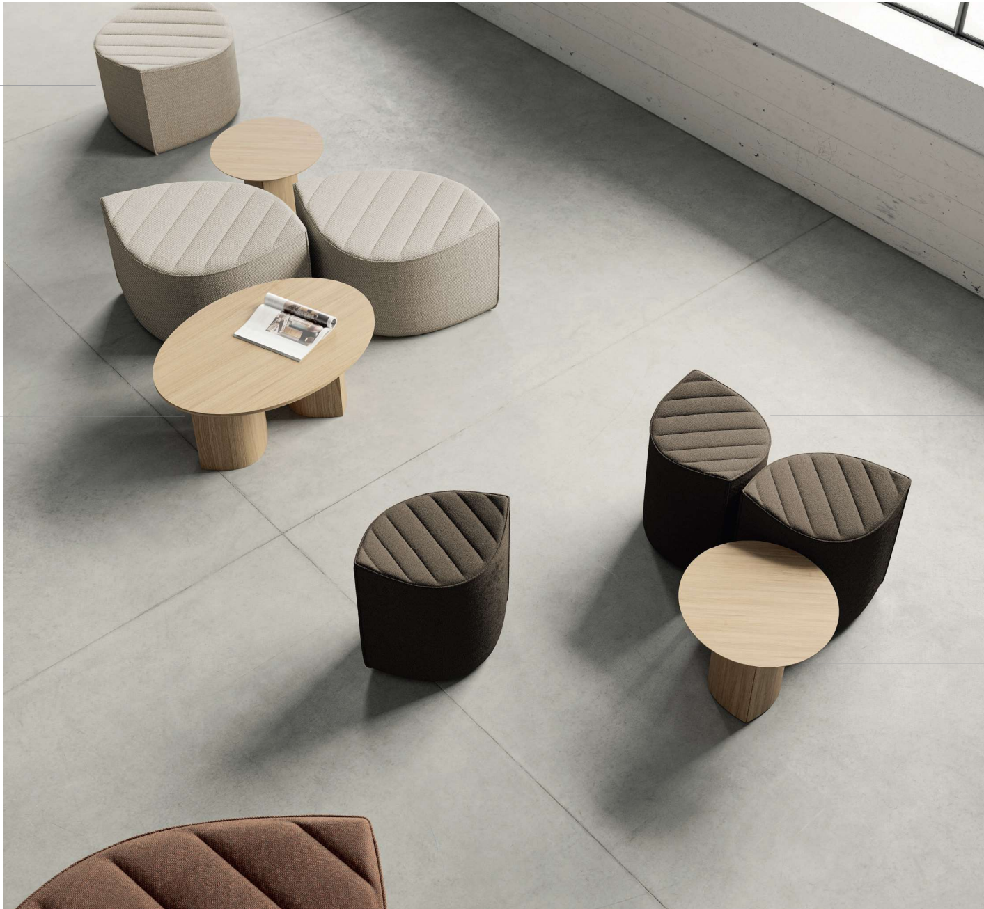
Ostoa Table Central Column