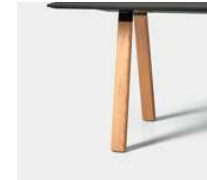
Solid oak (natural or stained) Roble macizo (natural o teñido)