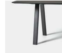
Aluminum tube (colours M1, M2) Tubo de aluminio (colores M1, M2)