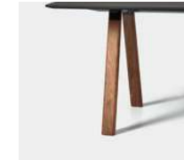
Solid walnut (natural) Nogal macizo (natural)